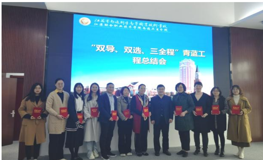
图 3：青年教师培养计划