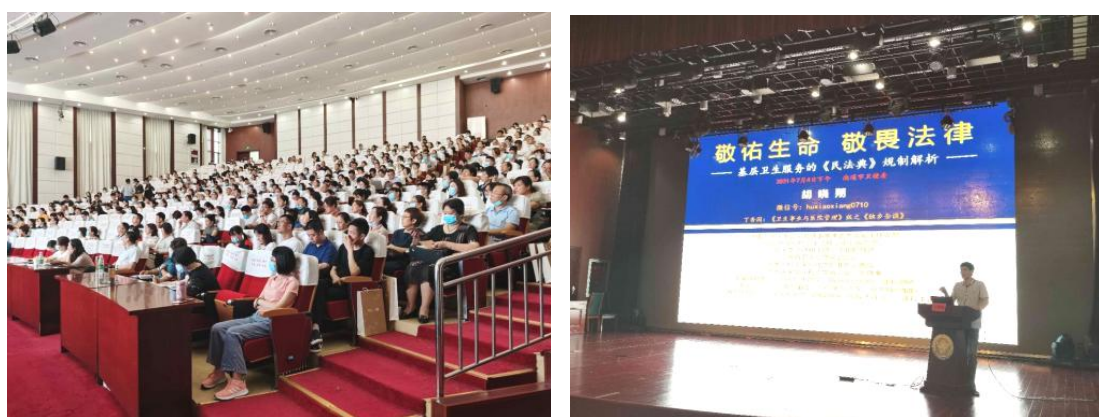
图 6：南通市基层医疗机构依法执业专题培训

依法执业是医疗机构开展诊疗服务的底线、红线。7月4日，南通市基层医疗机构依法执业专题培训会在南通卫生高等职业技术学校成功举办，此次培训旨在进一步加强基层医疗机构医疗质量管理，提升医疗纠纷与规范处理能力，全面规范依法执业行为，保障医疗安全，维护人民群众健康权益。参训人员在培训结束后纷纷表示受益匪浅，培训结束后将尽快对照法律法规的要求开展自查，主动纠正不合法不合规的疏漏点。此次培训为进一步规范我市基层医疗机构诊疗行为、持续提高医疗质量、保障医疗安全奠定良好基础。