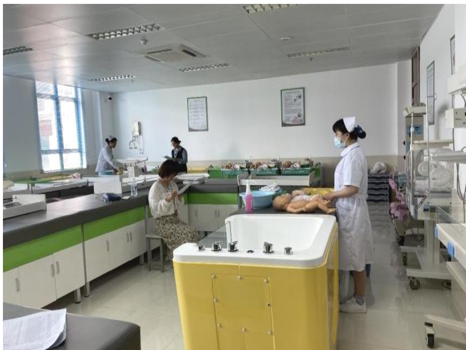
图 1: “1+X” 母婴护理考核