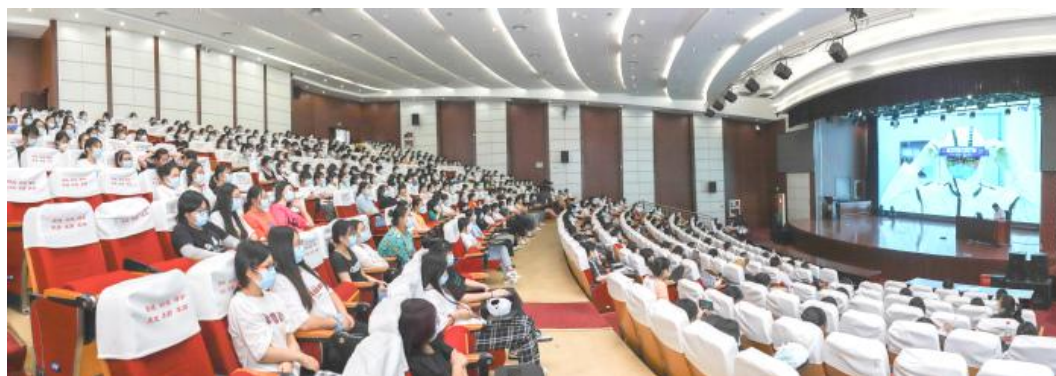
图 8：南通市全员核酸检测实战演练志愿者动员会

“国家有难，八方支援”，为保护崇川市民健康，积极响应市新冠肺炎疫情防空指挥部在全市范围开展全员核酸检测实战演练的号召，学校支部党员、系部师生纷纷踊跃报名，发扬学校“敬佑生命、救死扶伤、甘于奉献、大爱无疆”的新时代医疗卫生职业精神，积极参与到疫情防控演练中。