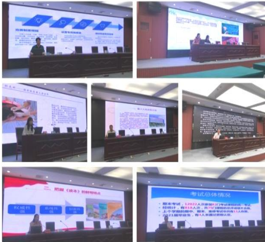
图 5：暑期临床实践情况汇报